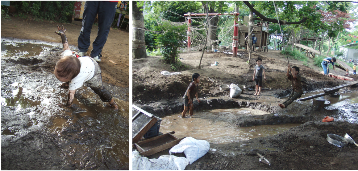
渋谷はるのおがわプレーパークで遊ぶ子どもたち

山田 (S) ：土を掘りに来ましたという子どもがいて、シャベルの奪い合いなんです。土が硬くて、よそでは掘れないんです。