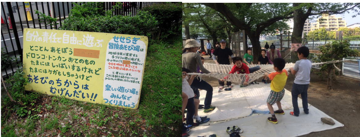
はるのおがわプレーパーク（上）、せせらぎ冒険遊び場（下左）、アメリカ橋プレーパーク（下右）

左京： 自主保育のときはのびのびと子育てができていたのに、渋谷の学校に行くことに落胆されたとおっしゃりましたが、具体的にどのような問題意識があったのでしょうか。