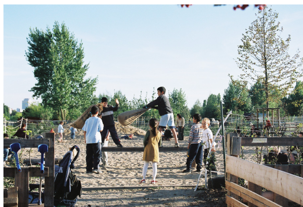
ドイツの冒険遊び場（adventuer spielplatz）（左）、ベルリンの壁にはさまれた軍事境界線上にあった緑地帯で新しくつくられた冒険遊び場